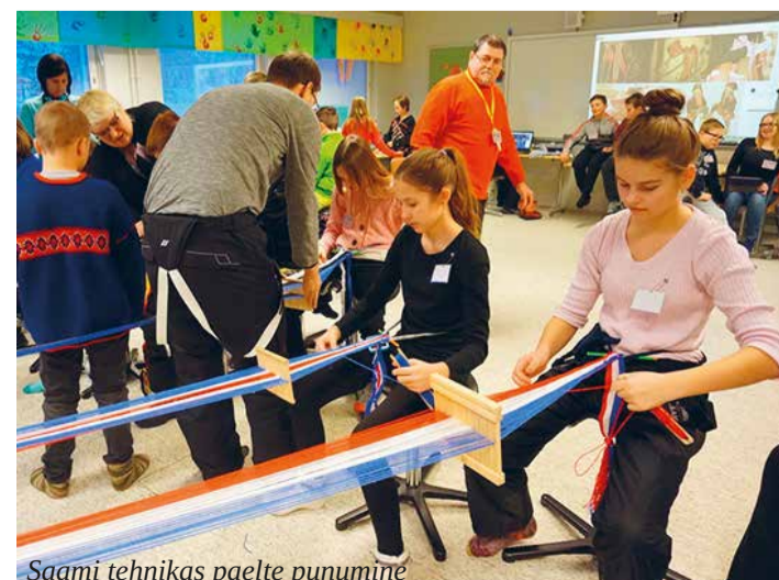
Saami tehnikas paelte punimine