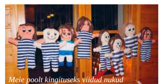
Meie poolt kingituseks viidud nukud

kordsel kohutamisel kinkis iga riik teistele riikidele oma nuku, mis tähendab, et iga riik sai oma seitsme kaasaõdetud nuku asemel endale seitse uut nukku. Kõige tõsisem töö oligi uute nukudega näidendi mõtlemine ja selle selgeks õppimine ning lavastamine. Lisaks külastasime reisi jooksul Virmalaste keskust, Põhjapolaarjoont, Jõuluvana küla, metsandus-