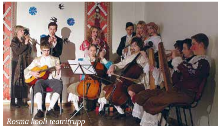
Rosma kooli teatritrupp