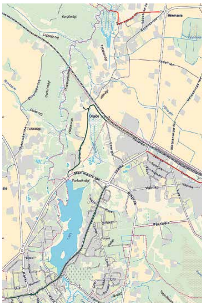
Kaardil on märgitud 2015. aasta suve tee-ehitused Põlva vallas