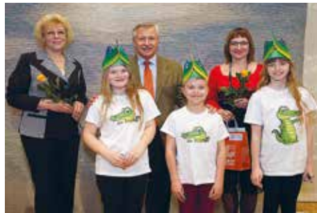
Põlva Ühisgümnaasiumi lauluansambel koos Saksa suursaadiku ja õpetajatega

Osalejatele ja nende õpetajatele toimus ürituse lõpetuseks vastuvõtt Rahvusraamatukogu Veskaru kohvikus.